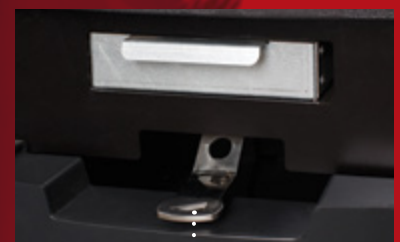
jednopáčkový mechanismus ovládání spalinového vzduchu